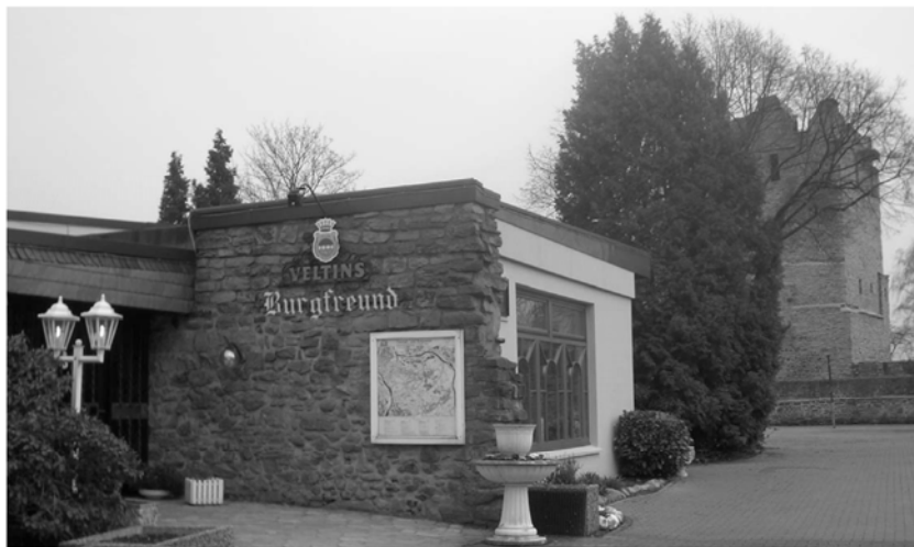
Café – Restaurant “ Burgfreund “ Burgstraße 2, 45289 Essen (Burgaltendorf) Tel. : 0201 / 578935