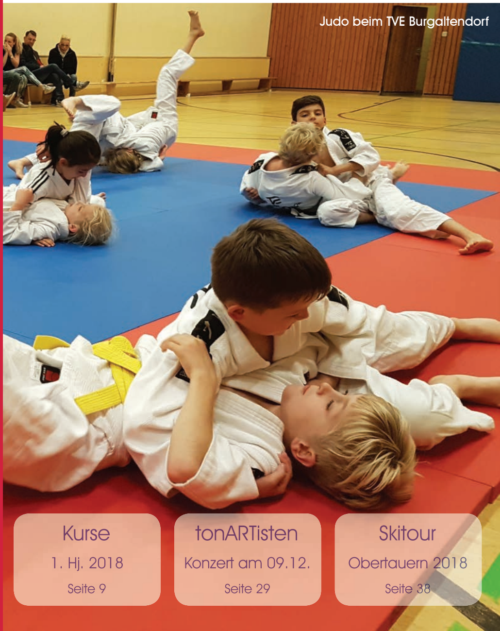
Judo beim TVE Burgaltendorf